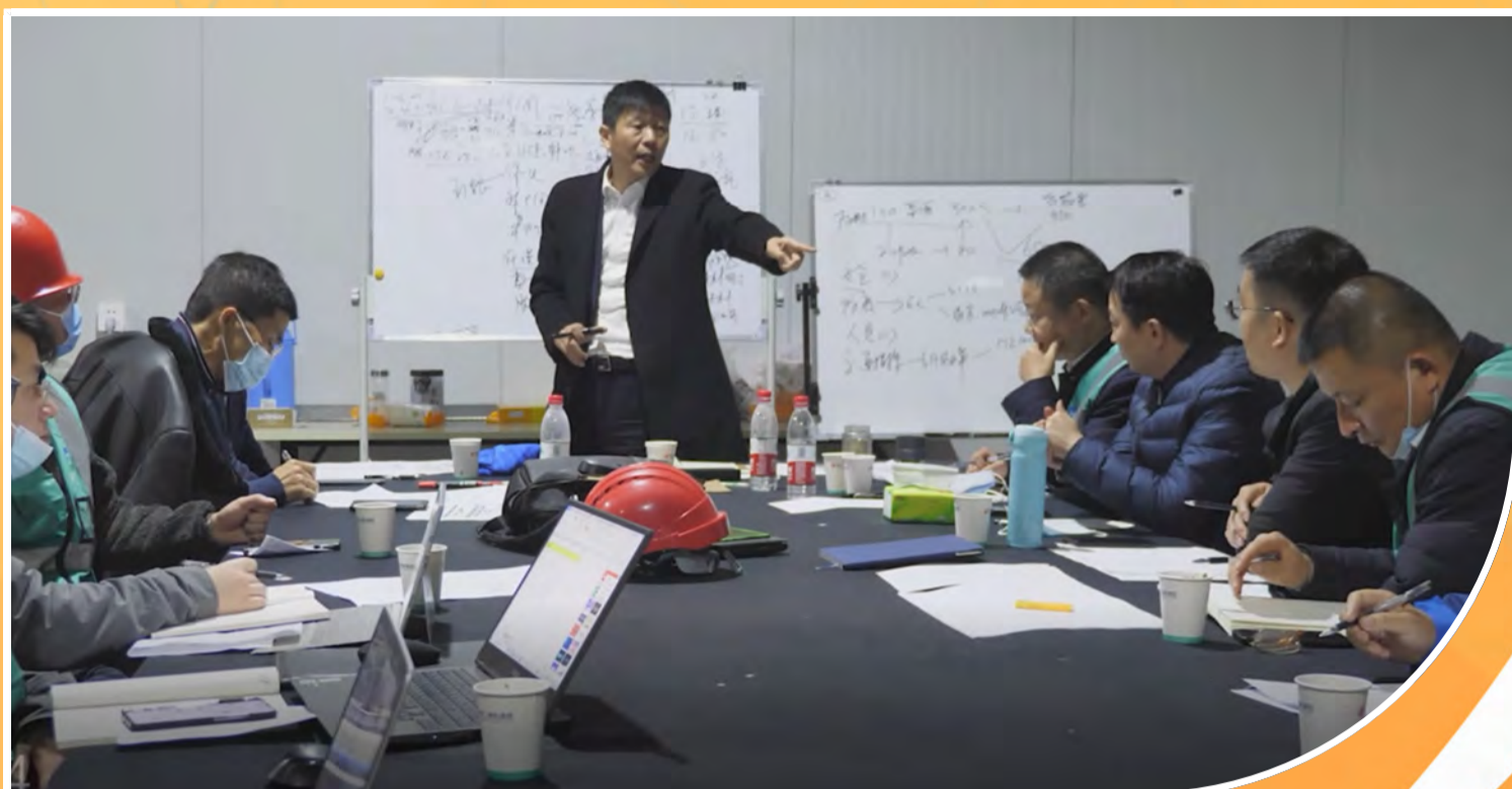
本刊供稿 孔依丽 何胜男

12月中旬,浙江多地发生疫情,新冠防控形势严峻。精工积极响应政府号召,承担了滨海隔离房项目建设、袍江马海工业园区7500名人员核酸检测服务工作。同时,以最快的速度、最好的状态积极奋战在核酸检测志愿服务最前线,在疫情防控中奉献绵薄之力。守望相助渡难关,勇敢担当抗疫情。我们的城市经历过一段艰辛的日子,但如今绍兴疫情形势积极向好,自12月31日起全市全域均已变为低风险地区。总有力量生生不息,精工共克时艰勇担当与各级政府和全市人民一起在疫情这场大考中共同书写了一份漂亮的“绍兴答卷”、“精工答卷”!