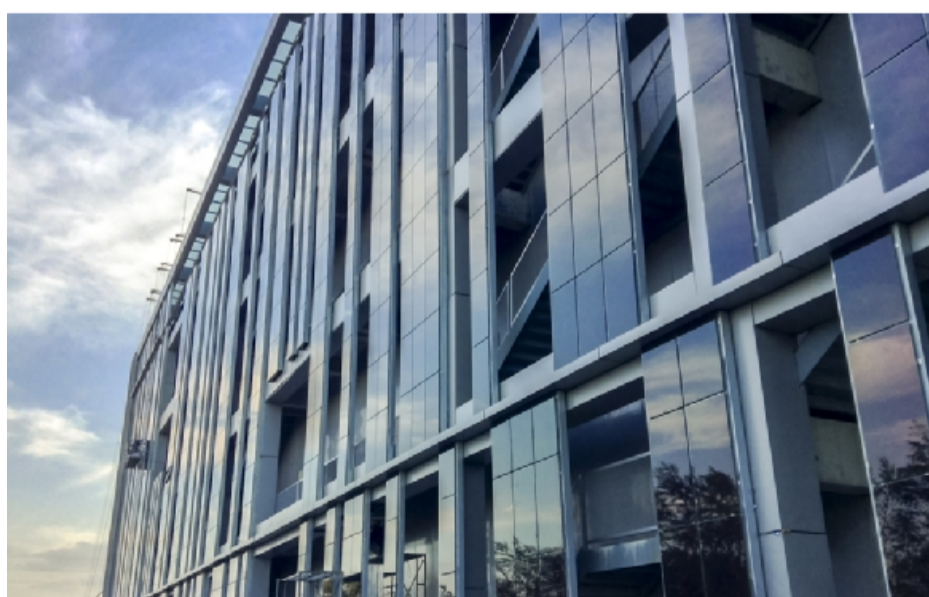
上海南侨立面电站

2017年的开门红对皖西宾馆来说无疑是振奋人心的,同时也是充满压力的。在这样的压力和动力下,皖西宾馆将持续提高产品质量,提升服务品质,为宾馆和集团创造更好的业绩。为实现更高的经营目标,皖西宾馆将持续保持新思路,出品新产品,更新新硬件,让皖西宾馆的“金招牌”更闪亮。