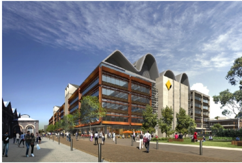
澳大利亚科技园项目

该项目是精工钢构与中建二局深圳分公司战略合作的新硕果,是继南宁万达茂、深圳沙涌、深圳金水贝等项目友好合作后的再一次升华。