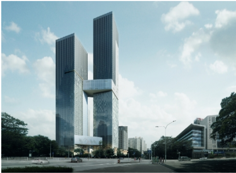
深圳湾创新科技中心钢结构制作工程

新年伊始,万象更新。精工钢构坚守创新驱动变革、转型促进发展,本着“用户成功才有精工钢构的成功”的经营理念,成功中标澳大利亚科技园项目、深圳湾创新科技中心钢结构制作工程、湖南广播电视台节目生产基地项目等钢结构工程项目,为新的一年迎来了振奋人心的“开门红”。