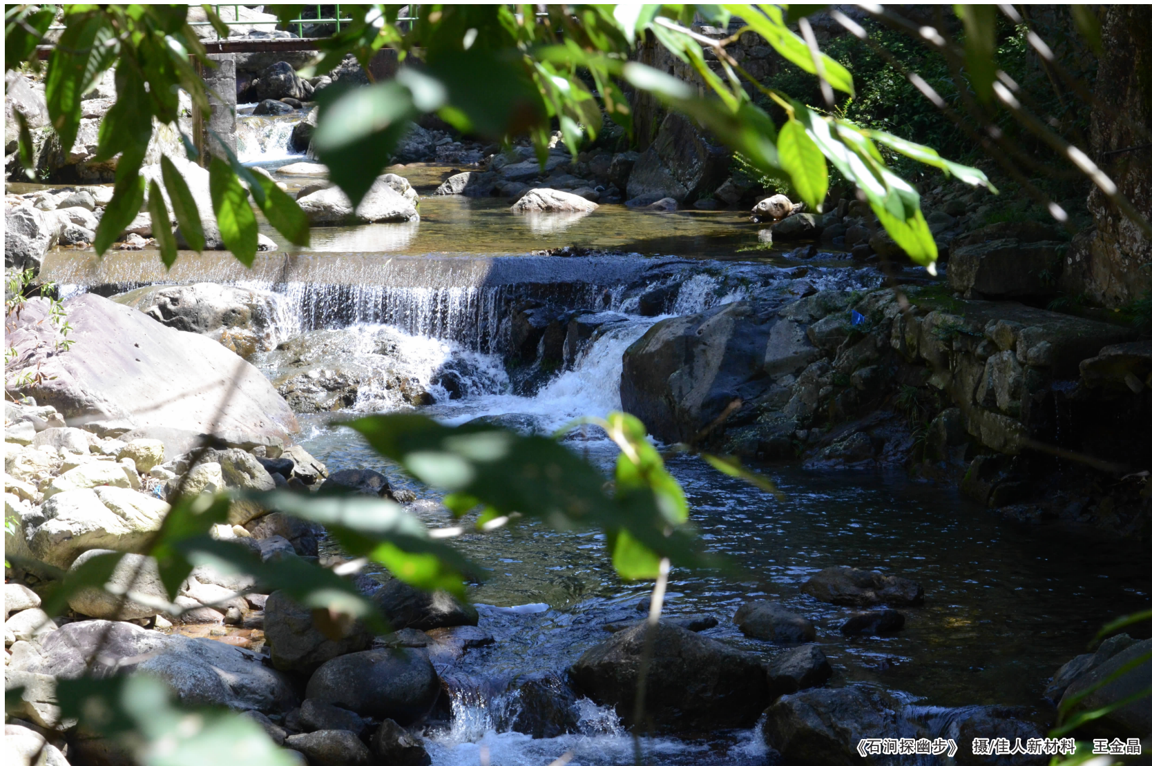
《石洞探幽步》

我总觉得朱自清是个永远有烦恼的人,连逛秦淮河,也是一副被烦恼纠缠的样子。也许是家事,也许是事业或是其他,总有事情能让他心里颇不宁静。怀着这样的心情,怎么能写出“风流”二字?