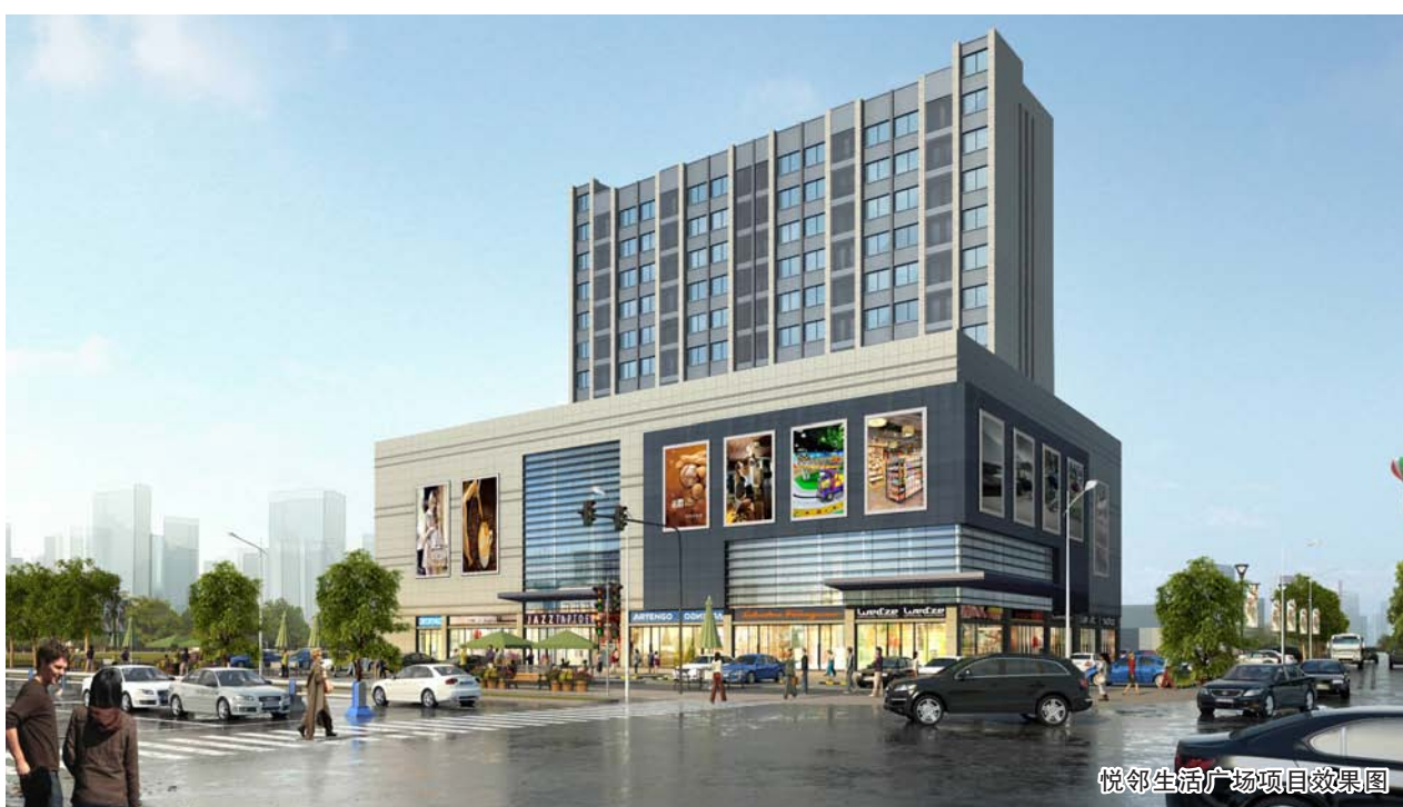
悦邻生活广场项目效果图

通过这次启动及交底会,项目各方主体达到了相互认识、充分沟通、明确责任、统一目标的目的,会议取得了预期的效果。后期项目部将根据会议的安排把各项管理措施、各项施工工艺落实到工程管理及施工中去,保质按期完成项目建设。