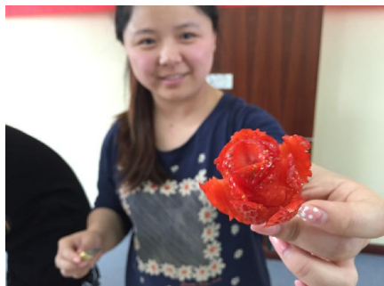
赠你一朵玫瑰,留我一手清香