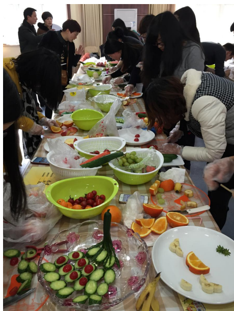
水果拼盘比赛现场

由控股工会委员、团委书记以及各公司领队组成的评委团,通过对作品的创意、色彩、营养搭配、制作等各方面的考评和选手们的创意解说,最终评出了一等奖1名,二等奖2名,三等奖3名以及优胜奖22名。