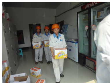
每日发放冰镇饮料，员工们拿着乐呵呵