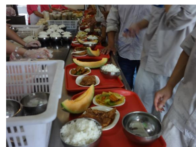
每周发放一份冰镇水果，员工们吃在嘴里甜在心里