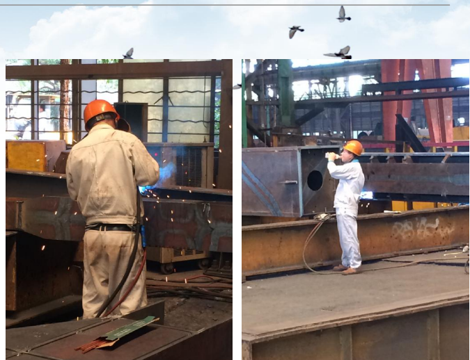
身着空调服，继续高温作业