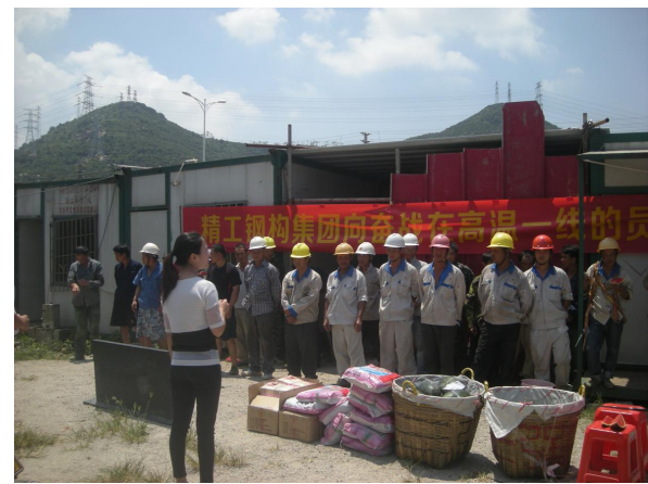
7月8日，陈副主席向珠海港日电梯高温一线的员工致以真挚的问候