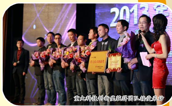
重大技术创新奖获奖团队接受采访