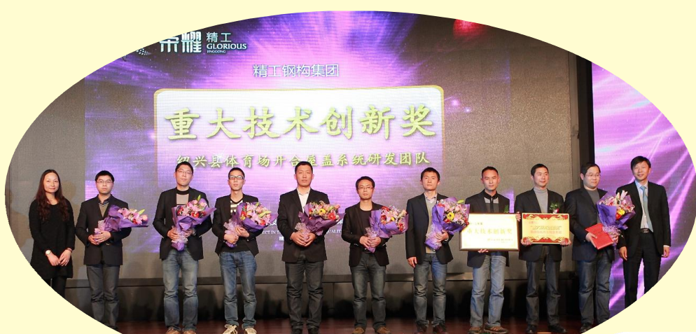
重大技术创新奖颁奖合影