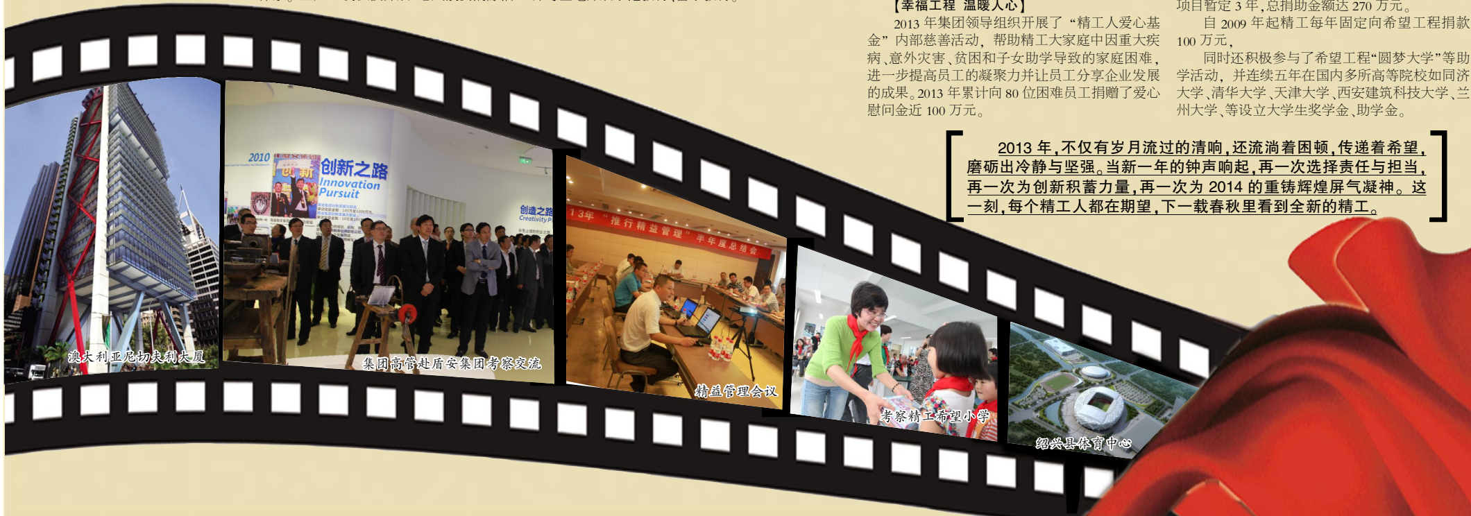
澳大利亚尼切夫利大厦

2013 年,不仅有岁月流过的清响,还流淌着困顿,传递着希望,磨砺出冷静与坚强。当新一年的钟声响起,再一次选择责任与担当,再一次为创新积蓄力量,再一次为 2014 的重铸辉煌屏气凝神。这一刻,每个精工人都在期望,下一载春秋里看到全新的精工。