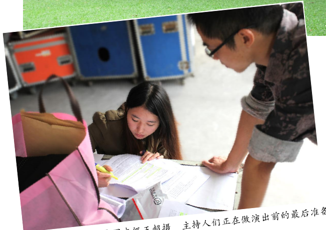
中秋谁最美 主持人们正在做演出前的最后准备