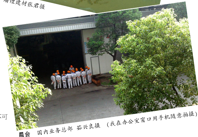
晨会 国内业务总部 茹兴良摄 (我在办公室窗口用手机随意拍摄)