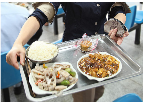
9月29日中午,为了营造中秋团圆、幸福的氛围,集团总裁办事务部联合公司食堂在中秋前推出系列活动——享中秋、送祝福、团圆餐,为每一位来食堂用餐的员工送上一份月饼。