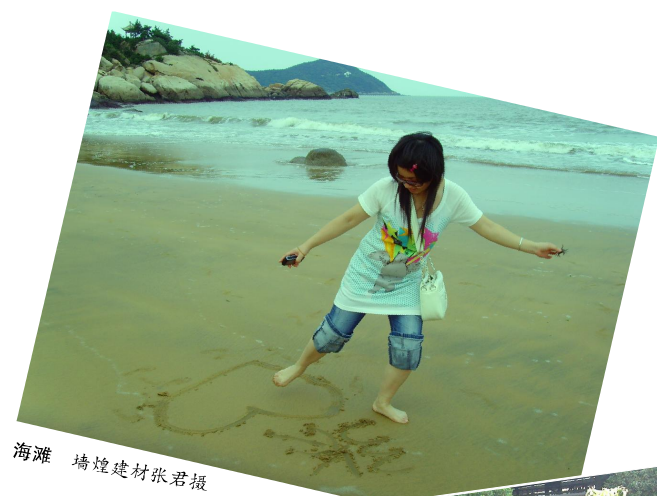
海滩 埭埭建材张君摄