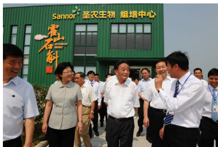
吴邦国委员长参观精工圣农组培中心